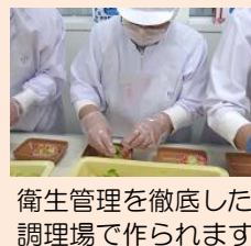
衛生管理を徹底した 調理場で作られます。

個別の専用箱に入れた 「ごはん」や「おかず」を 「保温カート」や 「保冷ボックス」に入れ、 各中学校（配膳室） に配送します。