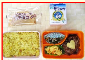
バレンタインランチ