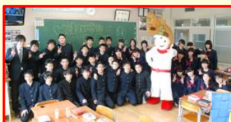
卒業祝い 「大野ジョーハッピーリング」デイ