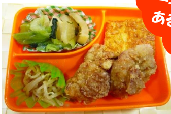
人気No.1の「特製から揚げ」

該当月の前月に配布される 月間注文表の「月間券」に 代金をそえて事務室で注文 します。