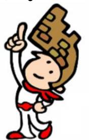
大野城市PRキャラクター 大野ジョー

※アレルギーに関する詳しい情報は、大野城市教育委員会までお問い合わせください※ (特定原材料を含むメニューの特定やコンタミ等)