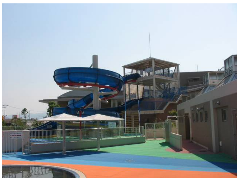
(Kita Public Pool)