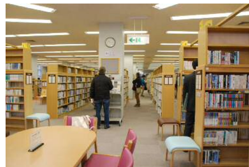
（まどかぴあ図書館）