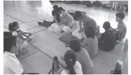
▲救急救命講習の様子

この機会に救急医療や救急業務の知識を深め、いざというとき、尊い命をつなぎ止める手助けをしてみてください。