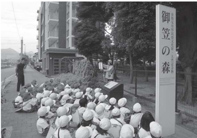
大野城市の歴史探訪(ふるさと文化財課)