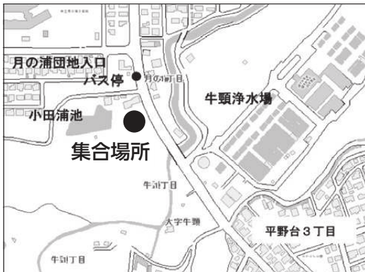
①(仮称) 小田浦史跡公園予定地