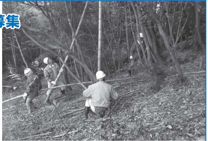
牛頸須恵器窯跡での作業の様子