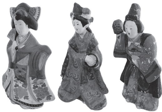
左から、娘道成寺、静御前、娘三番叟