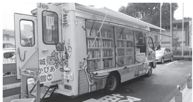
移動図書館「わくわく号」