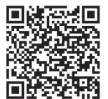
第2部 申込フォーム