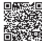
第1部 申込フォーム

※当日は、まどかぴあ多目的ホールと心のふるさと館で会場の様子をライブ配信します。申し込みができなかった人でも会場の様子を楽しめます。会場の混雑状況によっては入場できない場合があります。