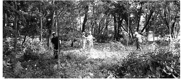
水城跡での活動の様子