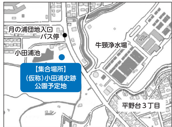
②(仮称) 小田浦史跡公園予定地