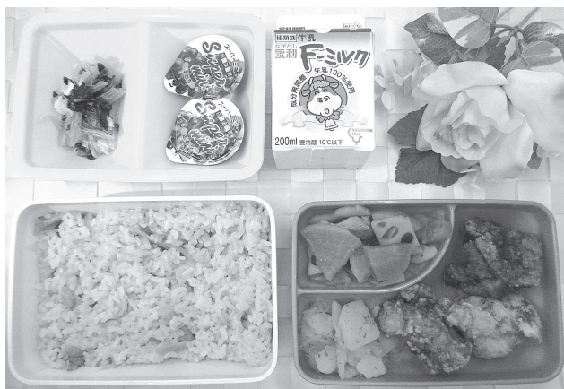
一番人気があるメニュー 鶏のからあげ