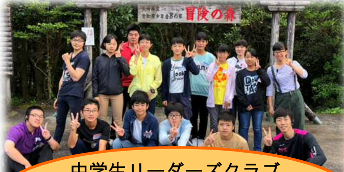
中学生リーダーズクラブ (大野城市内に在住、通学する中学生対象)