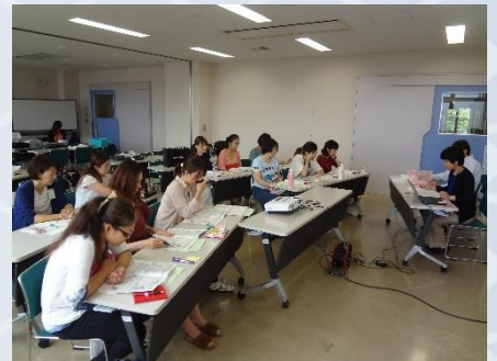
講座スケジュール